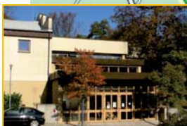
Sport- und Festhalle